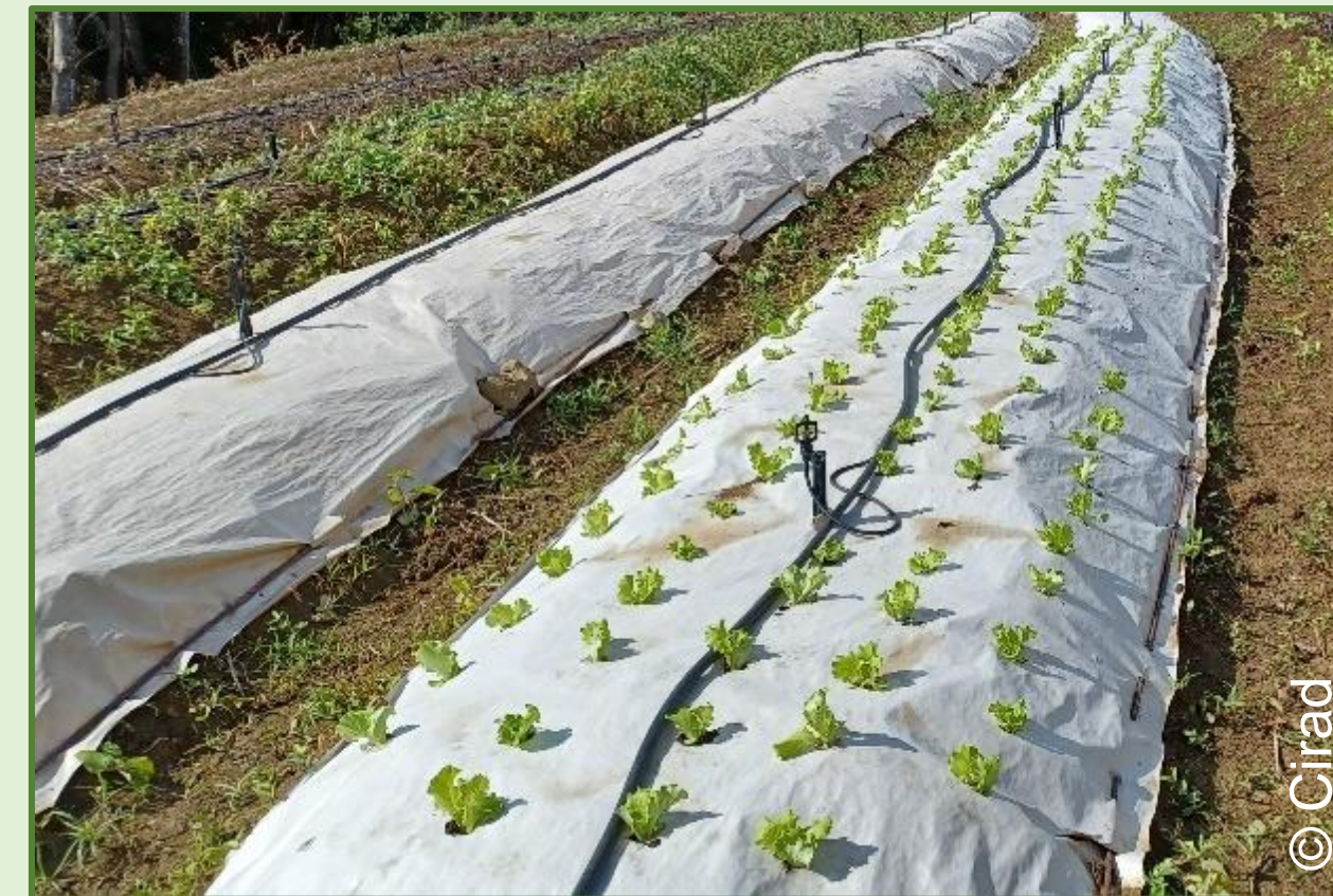
Paillage papier sur culture de laitues

Plus adaptés à des cycles longs (ou plusieurs cycles courts) et à des cultures espacées