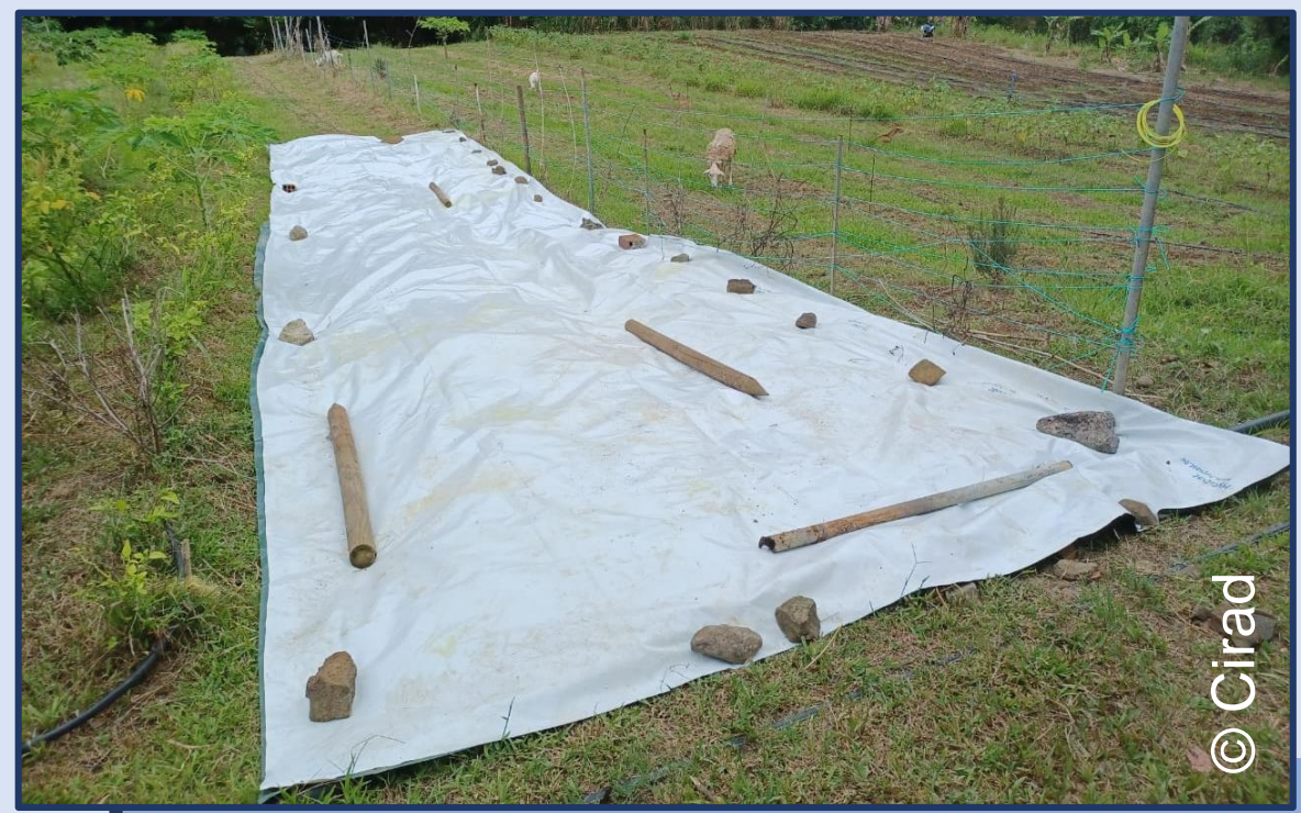
Bâche d'occultation - Le François