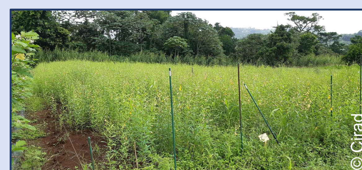
Engrais vert : crotalaire