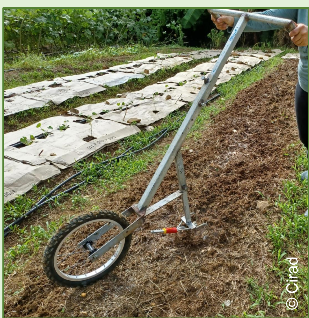
Houe maraîchère avec la herse à 3 dents

Sarcluse BF - MM STIHL (existe en universel)