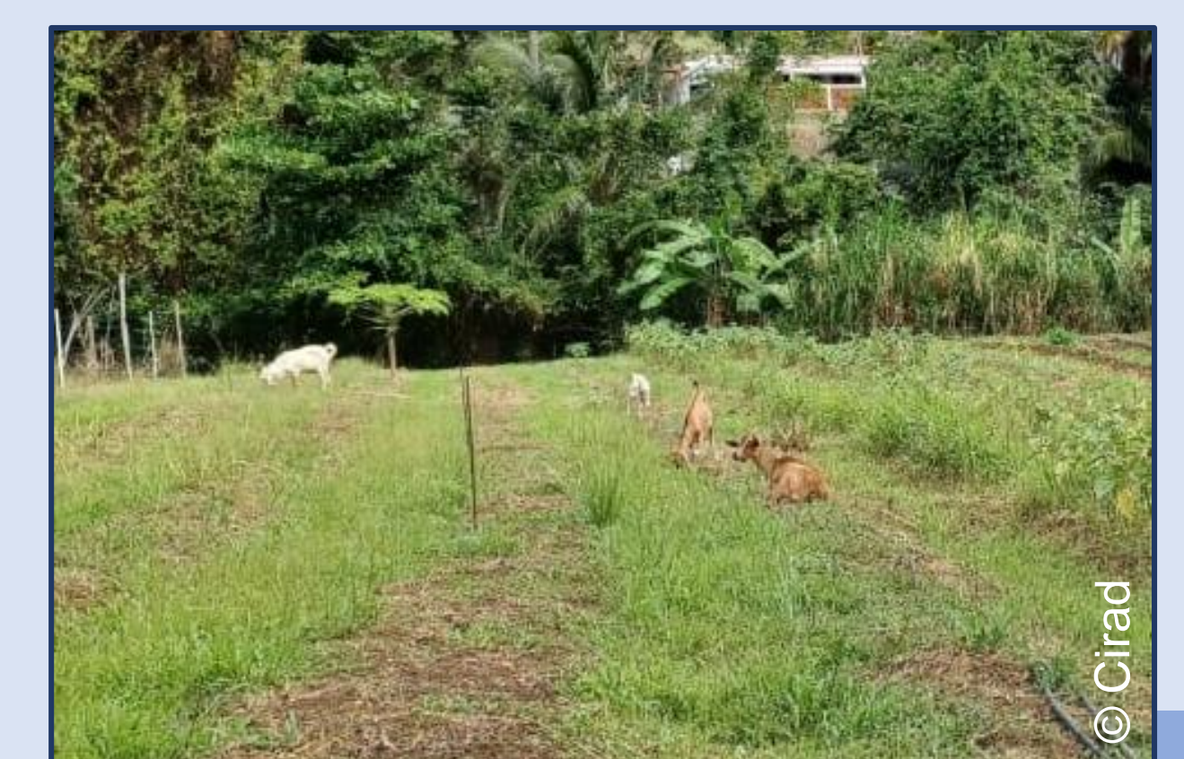
Pâturage d'ovins sur planches permanentes - Le François