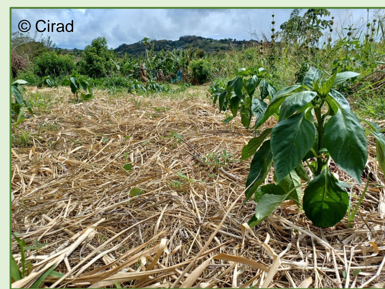
Paillage végétal d'herbe sur piment végétarien - Le Lamentin

Utiliser une épaisseur de paillage végétal importante garantit une meilleure gestion des adventices