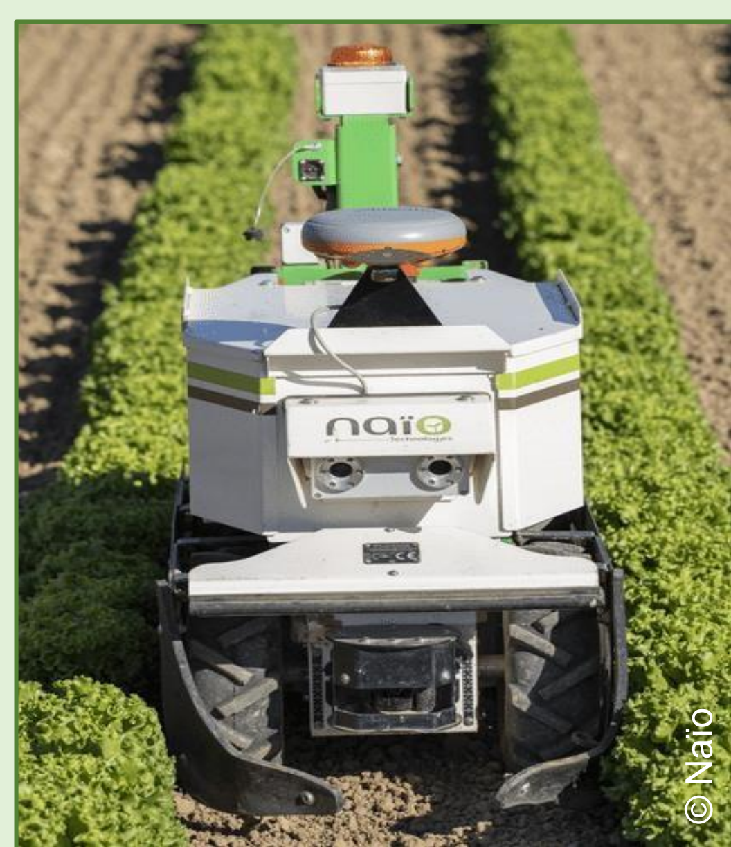
Robot Naïo Oz - Le Lamentin