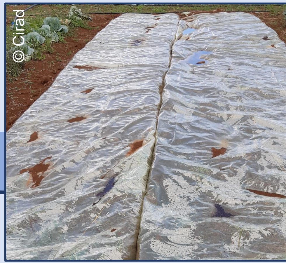
Bâche de solarisation