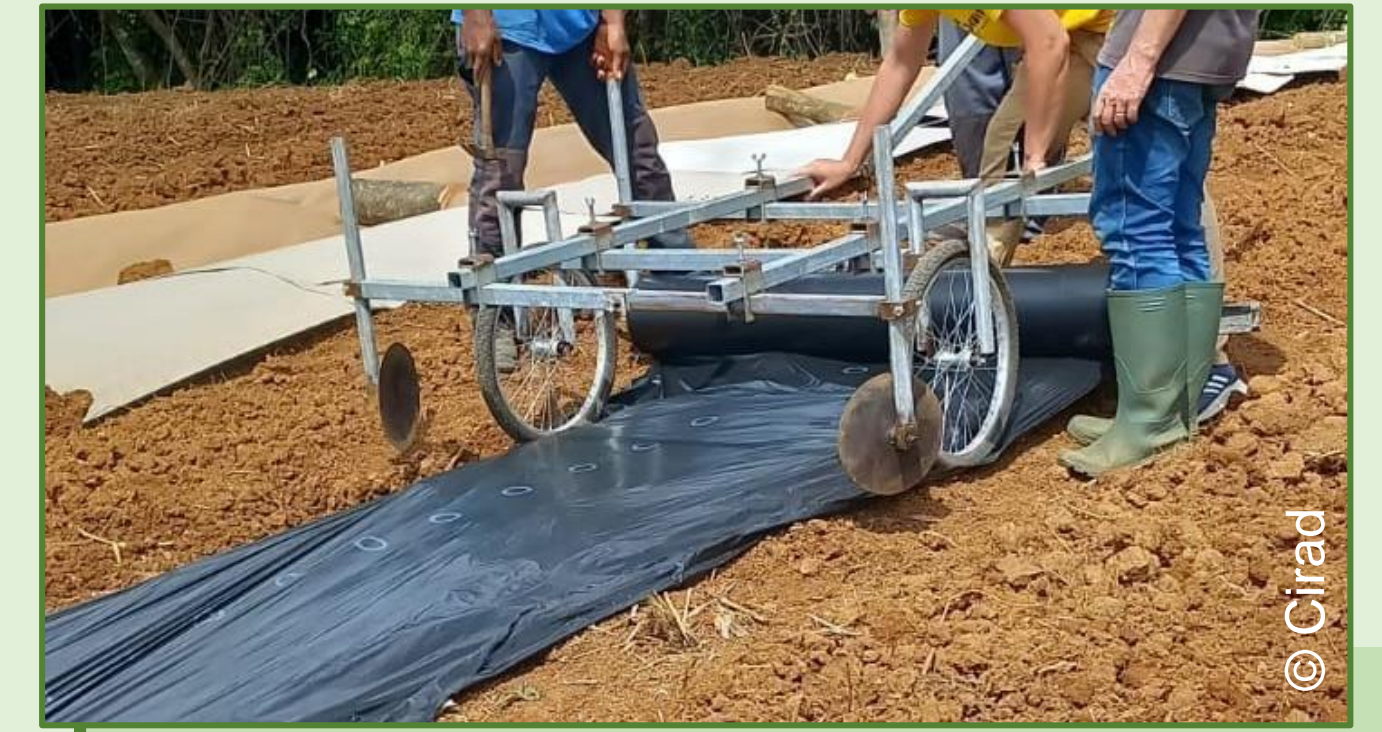
Film plastique sur dérouleuse manuelle auto-construite dans le cadre du projet RESILIANCE