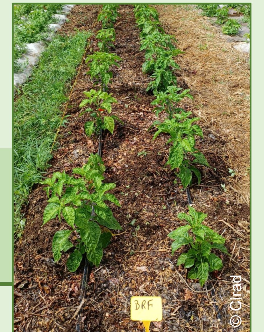
BRF sur culture de piments végétariens

Attention au risque de famine d'azote lors de la dégradation du BRF