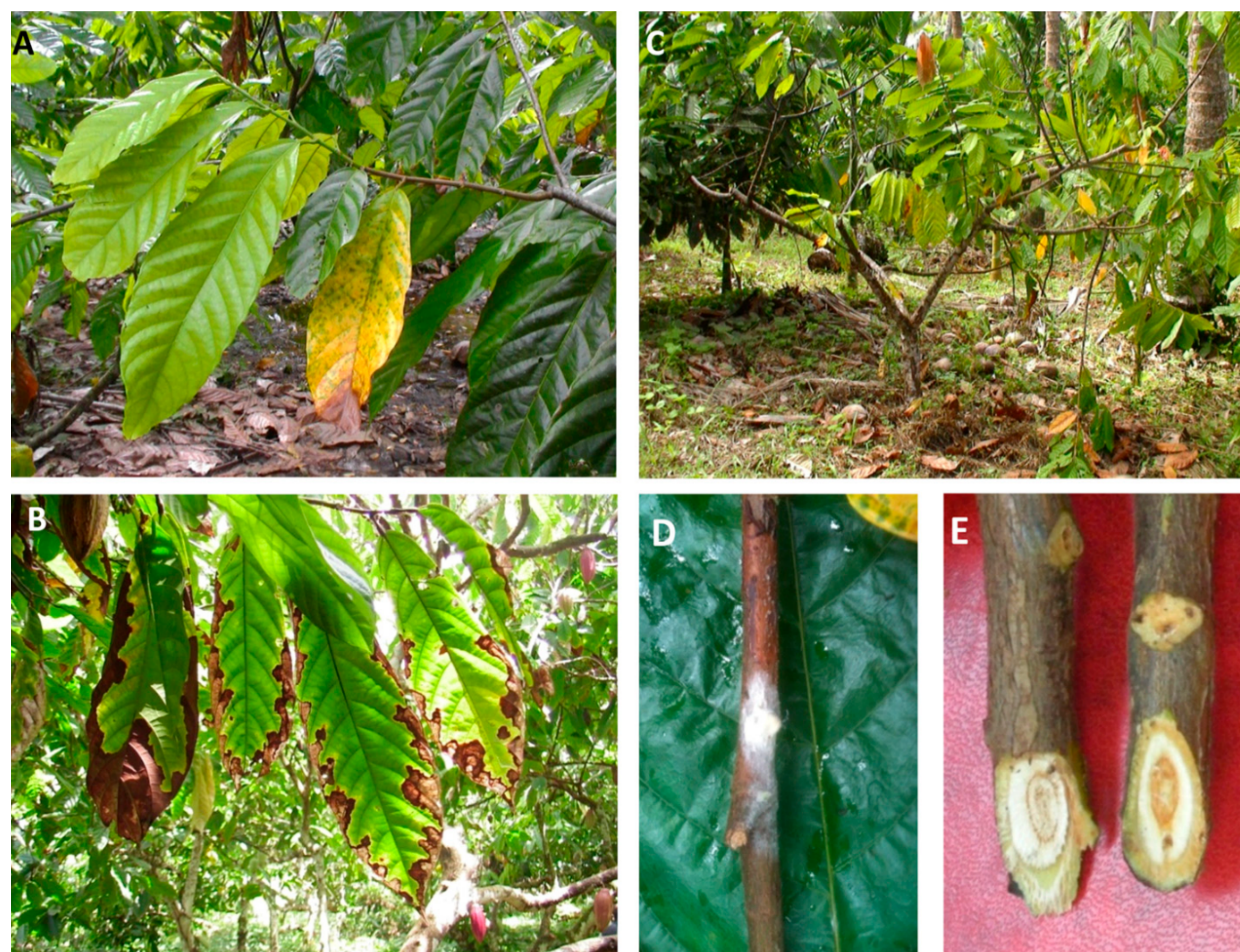
Symptômes du VSD sur cacao (Marelli et al. 2019)

Lors des essais de pathogénicité menés par le CIRAD en Guyane, des nécroses vasculaires ont été observées sur certains cacaoyers situés à proximité de plants de manioc malades, et la présence du champignon dans leurs tissus a été confirmée par analyses moléculaires.