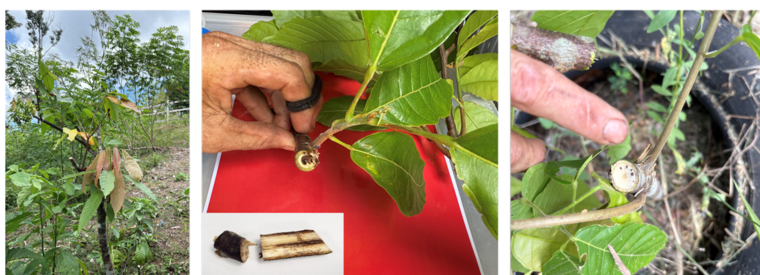
Symptômes d'une infection naturelle par Rhizoctonia theobromae sur Theobroma cacao observés dans une exploitation mixte cacao-manioc en Guyane française (Maazou et al. 2026)