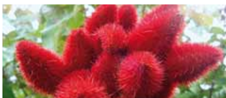
Les baies du Roucou (Amazonie) sont utilisées comme peinture corporelle par les Amérindiens et comme colorant dans l'industrie alimentaire.