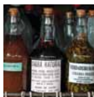
Préparations médicinales à base de plantes issues de la forêt amazonienne.

Les acteurs (paysans, exploitants forestiers, charbonniers, éleveurs, chasseurs-cueilleurs, planteurs, Etat, ONG, multinationales...) n'ont pas tous les mêmes priorités et peuvent se trouver en concurrence pour l'utilisation des ressources et des espaces.