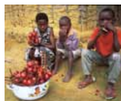
Fruits cueillis en forêt camerounaise.