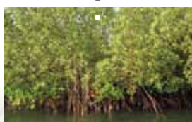
Mangroves au Sénégal.