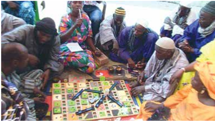
Illustration 2. La plateforme est conçue de façon à permettre des simulations prospectives complexes à partir d'éléments de modélisation simples, appropriables par tous.

À la fin des années 2000, le support de simulation est amélioré de façon à pouvoir être utilisé à grande échelle dans de multiples localités d'un pays, permettant ainsi une utilisation nationale pour l'élaboration concertée de politiques publiques (réformes foncières, codes règlementaires environnementaux, organisation de filières...).