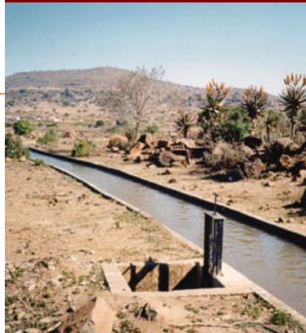
Área de regadío de Muden, Sudáfrica.

acompañamiento para la modernización de las redes de riego y la gestión de la salinidad