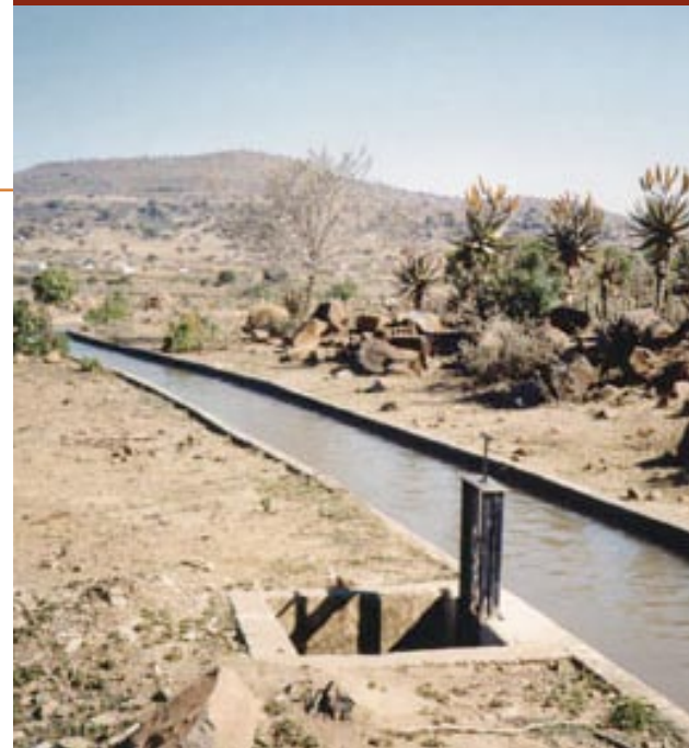
Périmètre irrigué de Muden, en Afrique du Sud.