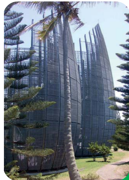
Centre culturel J.M. Tjibaou, structure en Iroko (Nouvelle Calédonie).

Ainsi, les bases de données et les bases de connaissances du Cirad sur les bois tropicaux ont de nombreux domaines d'application qui dépassent largement la valorisation des ressources forestières sous forme de bois d'œuvre.