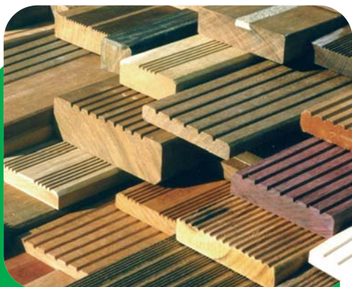
Différents profils de platelage en bois tropical.