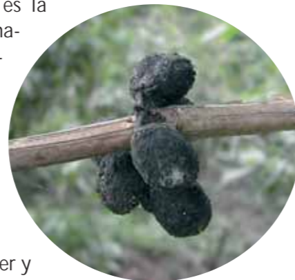
Fig. 3: Cerezas secas que se deben cortar en la repela.

1. La repela estricta es la recolección o eliminación de todas las cerezas, verdes, maduras y secas, presentes sobre los cafetos después de la cosecha y la poda de los mismos (Fig. 3).