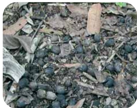
Fig. 2: Cerezas residuales del suelo albergando broca que se captura fácilmente con trampas.

Con el trampeo, se captura principalmente la broca que sale de las cerezas residuales del suelo (Fig. 2). Así, las trampas quedan funcionando, por lo menos hasta la emergencia completa de la broca.