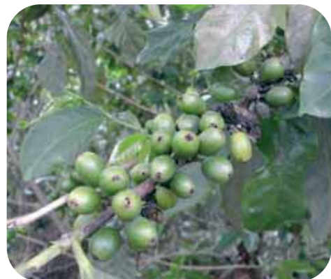
Fig. 1: Colonización de las nuevas cerezas por las hembras emergidas de las cerezas residuales.

Con la repela, la broca en proceso de migración no se puede refugiar en las cerezas residuales de las ramas y por lo tanto no podrá dispersarse de nuevo para colonizar los nuevos frutos (Fig. 1). Por otro lado, si se eliminan durante esta actividad, los pequeños frutos generados por las floraciones precoces que son los primeros frutos apetecibles, la efectividad de la repela será máxima.