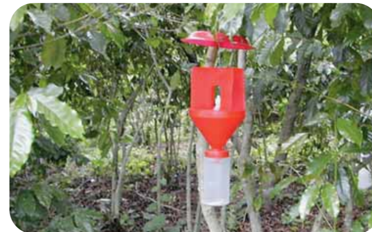
Fig. 4: Colocación de trampas.

3. El manejo agronómico comprende la poda de los cafetos, la regulación de la sombra y el ordenamiento del cafetal.