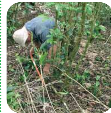
Fig. 5: Poda de cafetos.

- La poda de los cafetos se realiza inmediatamente después de la cosecha, con el fin de regular la cantidad de brotes productivos y mantener así, una producción adecuada. La práctica de eliminar ramas y reducir follaje ayuda a ventilar el cafetal y facilitar la penetración de la luz solar (Fig. 5). De esta manera, se acelera el desecamiento de las cerezas residuales caídas al suelo y por lo