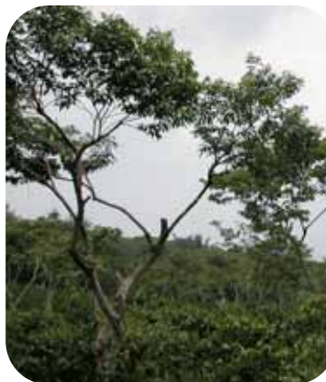
Fig. 6: Regulación de sombra.

tanto se reduce el desarrollo de las poblaciones de broca que sobreviven en estos frutos.