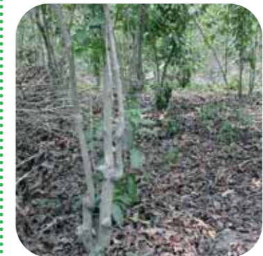
Fig. 7: Ordenamiento del cafetal (carrileado de leña).

- La regulación de la sombra que se efectúa en el transcurso del año tiene el mismo efecto (Fig. 6).